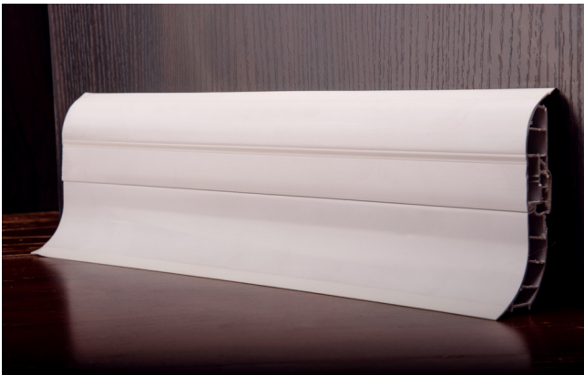
Zócalo sanitario PVC