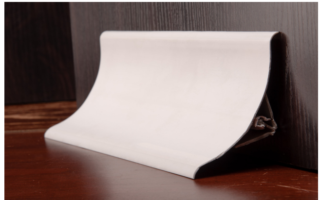
Media caña PVC